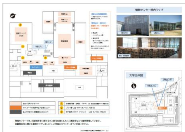
▲ 新入生ガイダンスで配布されるはずだった館内マップ。現在とは利用可能範囲が異なる。